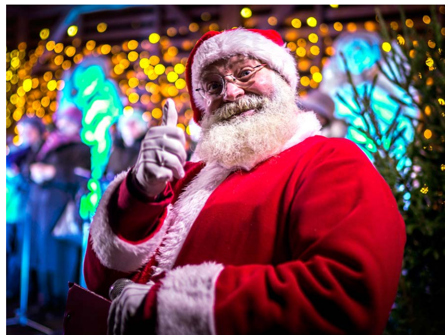
● 6 grudnia nasz kielecki Mikołaj poprowadzi Orszak. Ruszamy o godz. 16 sprzed pomnika Henryka Sienkiewicza.

Gotowana marchewka, pietruszka, jajka do tego ogórek kiszony, groszek i oczywiście majonez. Choć skrócony, to pewnie każdy rozpozna przepis na tradycyjną sałatkę warzywną. Właśnie takim smakołykiem będzie można poczęstować się już 13 grudnia, od godz. 14.