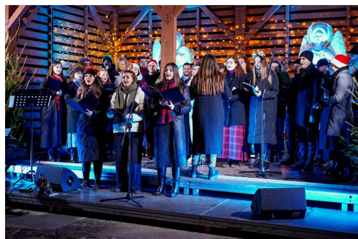
● Popołudniami zapraszamy na koncerty i dużą dawkę klimatycznych dźwięków.