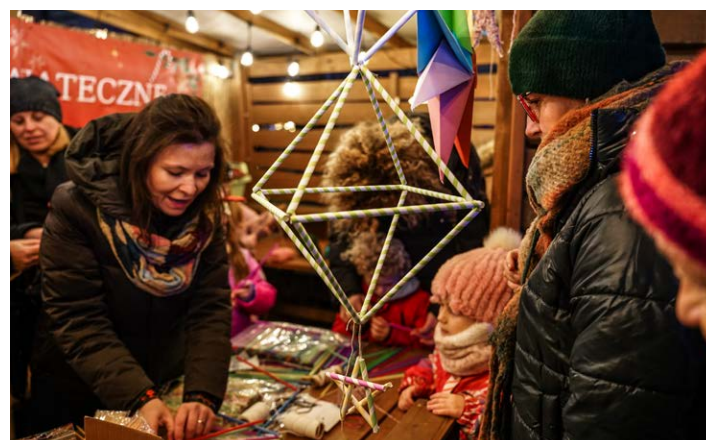
● Na warsztatach sami zrobicie ozdoby świąteczne, pocztówki czy zakładki do książek.