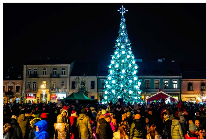
● Prawie 30 tysięcy światełek rozświetli nasze świąteczne drzewko.