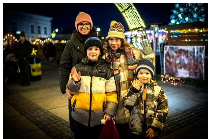
● KCK szykuje instagramową ściankę idealną do selfie. Niech cały internet zobaczy magiczne Kielce.