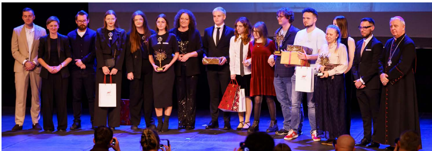
● Centralnym punktem Gali było wręczenie statuetek Laur Wolontariatu oraz uhonorowanie osób i organizacji, które udowadniają, że bezinteresowna pomoc to inwestycja w lepszą przyszłość.