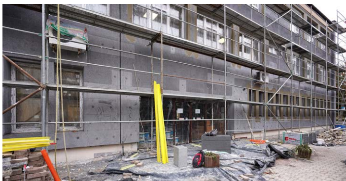
● W Zespole Szkół Ekonomicznych wykonawca prowadzi roboty w budynkach warsztatów, sali gimnastycznej i administracyjnym.

roboty prowadzone są na zewnątrz budynku.