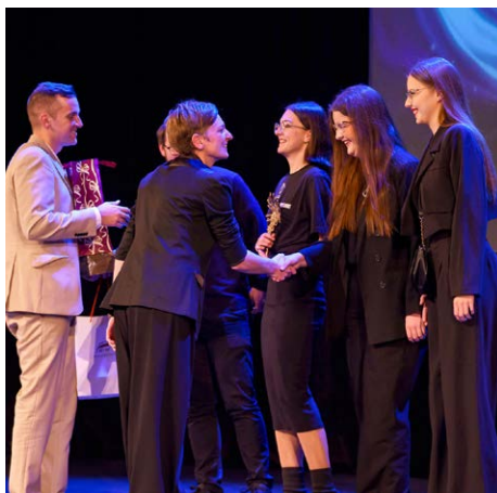
● Nagrodzona „Laurem” Grupa Wolontariuszy przy Klubie Sportowym ISKRA Kielce, od 12 lat obsługuje szatnie, sprawdza bilety, wspiera drużynę podczas meczów w Kielcach i nie tylko.