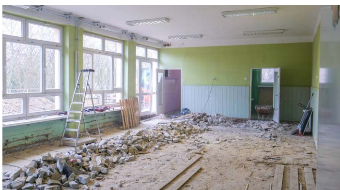
● W Przedszkolu Samorządowym nr 1 prace są mocno zaawansowane zarówno wewnątrz, jak i na zewnątrz budynku.

Po skończeniu robót w PS 1, kiedy dzieciaki wrócą do odnowionych pomieszczeń, do szkoły na Bocianku przeprowadzą się tymczasowo maluchy z Przedszkola Samorządowego nr 25, gdzie obecnie