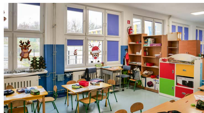
● Na potrzeby przedszkolaków wydzielono część parteru oraz szatni w Szkole Podstawowej nr 1.

Zgodnie z harmonogramem idą prace w VI Liceum Ogólnokształcącym. W 100% wymienione są m.in. instalacja c.o., okna i drzwi. Trwają prace na dachu, przy ocieplaniu