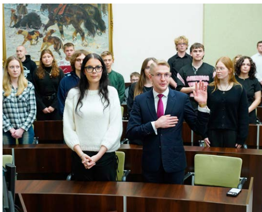
● Radni V kadencji złożyli ślubowanie, odebrali zaświadczenia o wyborze i przedstawili pierwsze kierunki swoich działań.

– Przede wszystkim cieszymy się, że udało nam się zmobilizować młodzież do działania i wypromować młodzieżową radę. Zorganizowaliśmy także Ogólnopolską Integrację Rad Młodzieżowych, podczas której wraz