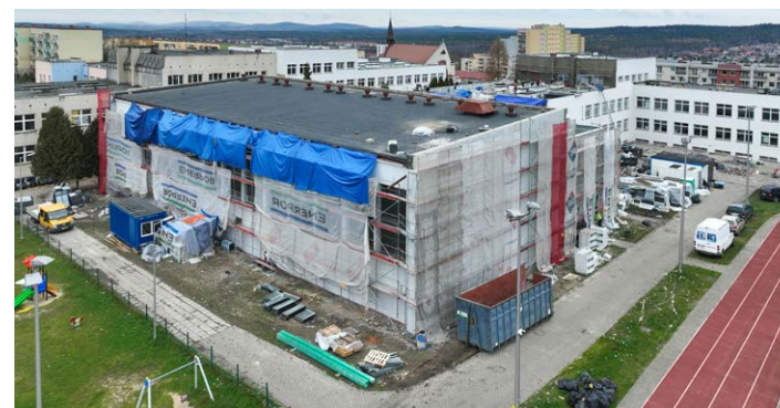
● W Szkole Podstawowej nr 33 wymieniono dachy i okna w większości segmentów.