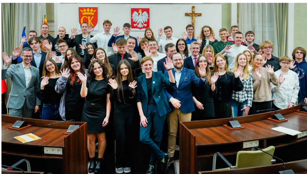
● Przed nowymi radnymi dwa lata pełne wyzwań, projektów i działań na rzecz młodzieży w Kielcach.